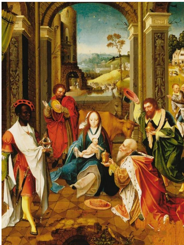
Abraham Bloemaert: A bölcsek imádása (1624)

Nem minden zsidó élt azonban a babiloni fogságból való visszatérés lehetőségével. Sokan önként Babilonban maradtak, ahol nagy vagyonnal vagy magas társadalmi pozícióval rendelkeztek, amiről nem akartak lemondani. Erős közösség volt ez, amely befolyást gyakorolt az egész zsidó vallásra. Perzsiában keletkezett a Talmud is, a zsidó törvénykönyv és bibliaértelmezések tárháza.