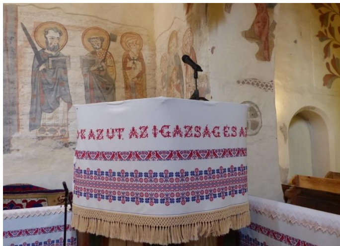
Csaroda, református templom

Gondviselésszerű, hogy a II. Vatikáni Zsinat után a plébániát és az egyházmegyét mint közösséget tekintette jogi személynek az egyház. Tehát maga az egyház is így határozta meg. Korábban a terület, a javadalom stb. minősült jogi személynek, mostantól kezdve a közösségek. A közösségnek pedig, ha egyszer jogi személy, akkor cselekedni is kell. Ha cselekszik, ki kell alakítania az akaratát, tehát szükségképpen megkíván egyfajta együttműködést, ami egyébként a történelemnek a parancsa.”