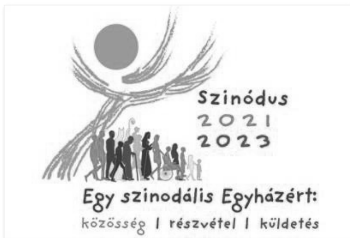
A szinódus logója

Az egész szinódus célkitűzése arról szól, hogy az egyház minden szintjén legyenek javaslatok a megújulásra. Igazából ez is nagyon hasonlít a Hálóhoz, hiszen független, saját arculattal rendelkező közösségeket, kerületeket, régiókat képzelünk el a Hálóban, amelyek saját maguk alakíthatják ki a működésüket, miközben mindenki számíthat a másik támogatására, és ez az önállóság mégis inkább növeli az összetartozás érzését, semmint csökkentené azt.