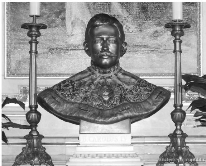
Boldog IV. Károly hermája

„Minden erejét a béke megteremtésére fordította, támadások és meg nem értettség árán is. Ezért napjainkban is követendő példa számunkra, kinek közbenjárását kérhetjük az emberiség békéjének érdekében” – mondta róla XVI. Benedek pápa, akinek elődje, Szent II. János Pál (öt apja, a IV. Károly iránti tiszteletéből nevezte el Karolnak) 2004. október 3-án boldoggá avatta. Tiszta jelleme, mély vallásossága, példás családi élete, a sorscsapások hősie elviselése az egyház értékelése szerint mintaként áll az utókor előtt.