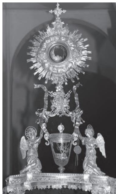
A lancianói eucharisztikus csodaereklye, felül a hússá vált szentostya maradványa, alul a vérré vált bor

Az átlényegülés tagadásával egyidejűleg azonban rendkívüli eucharisztikus jelenségek tömege történt. Az olaszországi Alatriában, a Szent Pál-székesegyházban őrzik azt a szentostyaereklyét, melyről IX. Gergely pápa 1228. március 13-i bullájában emlékezett meg. 1263-ban, ugyancsak Olaszországban, Bolsenában esett meg az egyháztörténet egyik legnagyobb visszhangot kiváltó csodája, melynek során egy szentmise alatt, az átlényegülésben kételkedő pap kezére a konszekrált szentostyából vércseppek kezdtek hullani. A megdöbben pap a korporáléval (oltárkendő) itatta fel a vért. A vérfoltos korporálé ma is