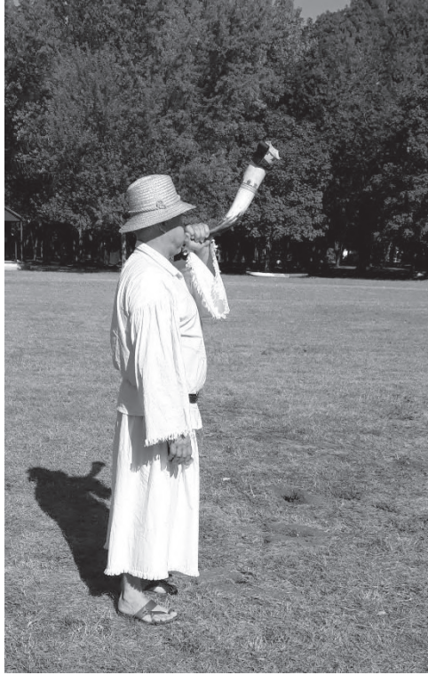
Békés-Dánfok, 2021