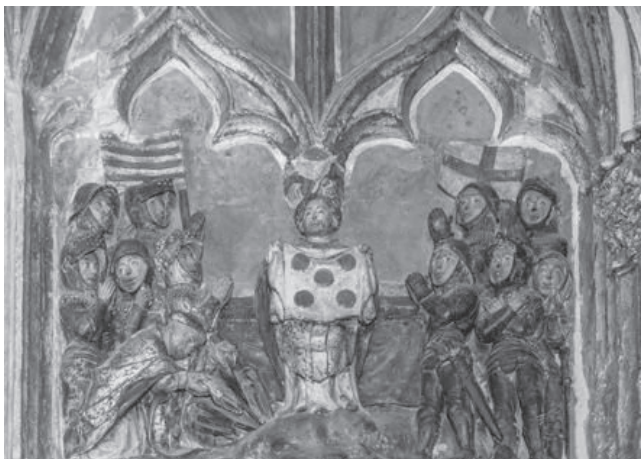
Az eucharisztikus csodát ábrázoló dombormű a darocai Legszentebb Szűz Mária-templomban

olaszországi Sienában esett meg, ahol 1730-ban az ottani ferences templomból elloptak egy 351 konszekrált szentostyát tartalmazó áldoztató kelyhet. Az ostyák nagy részét megtalálták egy perselybe dobva. A szerzetesek úgy döntöttek,