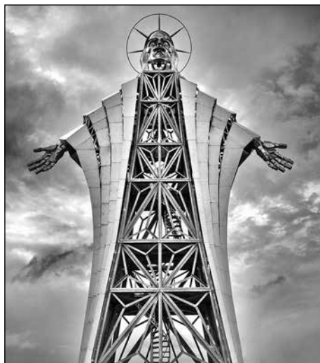
JÉZUS SZÍVE KILÁTÓ – GORDON-TETŐ, ERDÉLY

A szobor kilátóként is funkcionál; az alkotás testében csigalépcsősor kapott helyet, amelynek segítségével el lehet jutni a szobor fejrészébe,