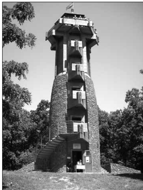
FÜLÖP-HEGYI MILLENNIUMI KILÁTÓ – RÉVFÜLÖP

próbálok így működni. A kosaras csapatom tud az énekkarosról, ők ismerik a „Klastrom klub”-os közeget és – természetesen – mindenki ismeri a Háló-s kötődésemet... 😊 Hívogatom őket sokszor közös találkozási alkalmakra.