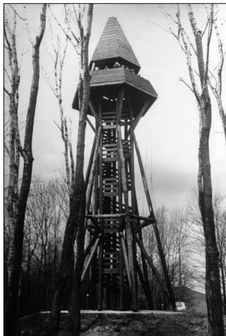
KÓS KÁROLY KILÁTÓ – CSÓR-HEGY, MÁTRA

munkát is kiadni a kezükből. Például egy játék levezetését, vagy a beszélgetésekhez egy-egy kérdés megválasztását, de nyugodtan átadhatjuk akár a térképet is a kirándulás során. Természetesen ezekről előre egyeztessünk, hogy senkit se érjen meglepetés!