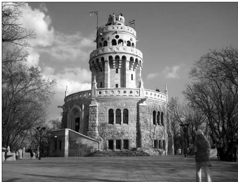
ERZSÉBET-KILÁTÓ – JÁNOS-HEGY, BUDAPEST