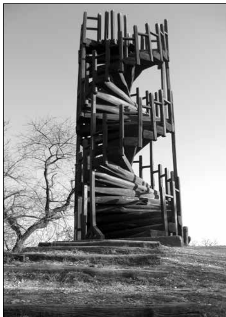
KIS-HÁRS-HEGYI KILÁTÓ – BUDAPEST

vagyunk. Bárki eljöhét az alkalma-inkra vendégként, mi szeretettel fogadjuk. Az is szolgálat lehet, hogy részt veszünk a közösségi programokon, és ott megszólítjuk az embereket. A megszólítás és a meghívás is fontos misszió.