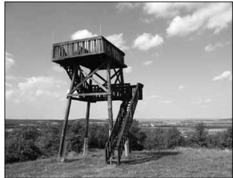
HÁZ-HEGYI KILÁTÓ – ÁGFALVA

meghatározott, mindenkit érdeklő témáról beszélgetünk mindannyian, merjük kisebb csoportokra (5-6 fő) bontani a csapatot. Egy kisebb létszámú körben jobban meg mernek nyílni az emberek, és aktívabban bekapcsolódnak a beszélgetésbe.