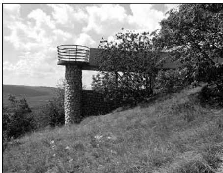
KIS-TUBES KILÁTÓ – MECSEK

Elsősorban egy fantasztikus, vidám, játékos estét köszönhetünk az egész programnak, amikor ki tudtunk szabadulni a hétköznapiokból, új embereket tudtunk megismerni. De ami talán még ennél is fontosabb, hogy rájöttünk, szükség van erre a fajta nyitottságra is. Bár egyesével életünkben, kapcsolatainkban próbálunk nyitottak lenni az emberek felé, de egy közösség, egy kollégium nyitottsága más for-