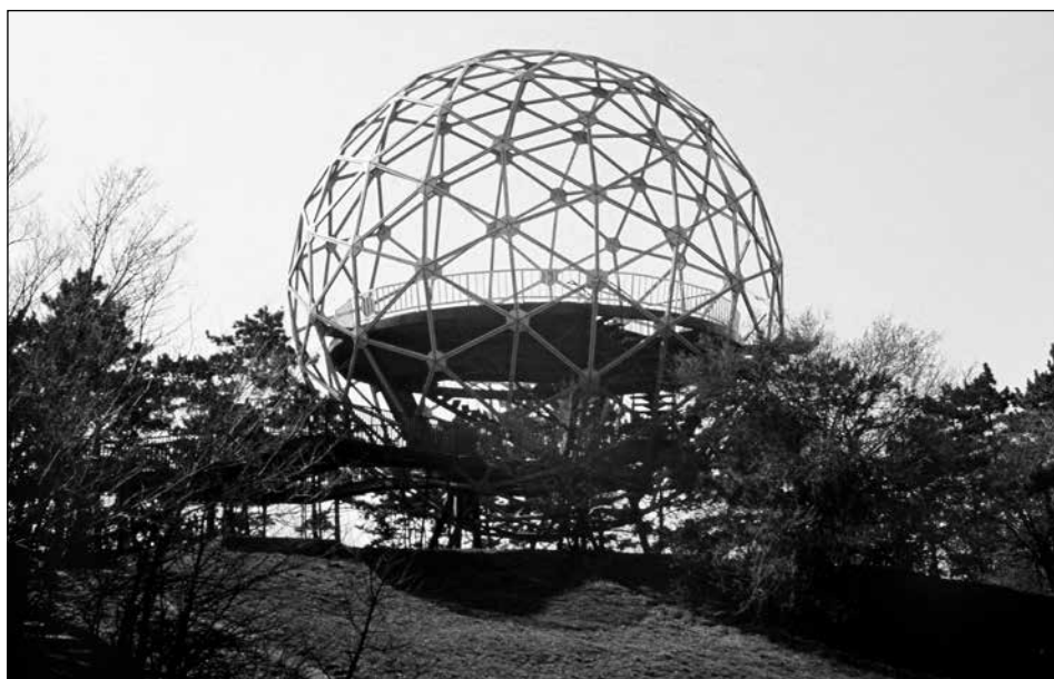
XANTUS JÁNOS GÖMBKILÁTÓ – BALATONBOGLÁR

és úgy köszöntötte tanítványait, hogy „békesség nektek”. Ebből maradt a jól szabályozott életek bezárt biztonsága, vagy a kitörés, a szabadság csonkítása: ki hogyan éli meg ugyanazt.