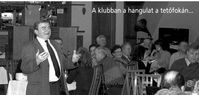
A klubban a hangulat a tetőfokán...